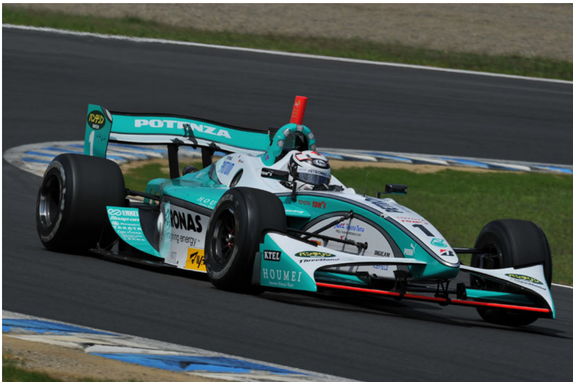
#1 アンドレ・ロッター (ペトロナス・チーム・トムス)