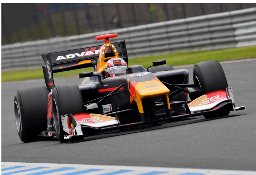
初優勝を飾った No.15 ピエール・ガスリー(チーム・ムゲン)